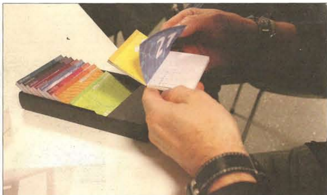
De bureaul kalender van BiblioVanGerwen winnaar van een categorie- en de KVGOPrijs

discussie uiteindelijk een winnaar werd aangewezen. De agenda van Elco Extensions bevond zich tijdens deze beoordelingsronde in het goede gezelschap van de 'Daglicht scheurkalender' van Zwaan printmedia. De Zaanse drukkerij die ook al jarenlang hoge ogen gooit en een reeks aan kalenderprijzen wist te winnen. Ondanks de fraaie nominatie grijpt ook Zwaan, net als Ando, dit jaar naast de prijzen. Dat geldt niet voor de derde genomineerde in deze categorie, Andi Druk, maar daarover later mee. De prijs voor meest creatieve en originele inzending gaat namelijk naar Elco Extensions voor de '24-uurs agenda voor Dagdromers en Nachtvinders'.