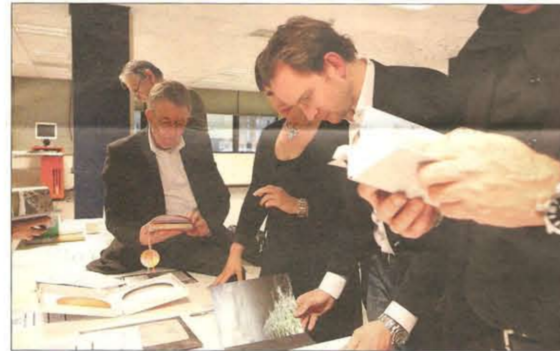
Intensieve aandacht van de jury voor de fraaie agenda's van Ando, Elco Extensions en winnaar PrintVisie

nemen genomineerd. De uiteindelijk prijswinnaar werd zoals gezegd BiblioVanGerwen, met een geraffineerde en tegelijk simpel van opzet zijnde kalender die bestaat uit twaalf aparte kalenderblokjes die achter elkaar in een doos zijn geplaatst tegen een schuine achterwand. Creatief en toch bruikbaar. En juist die twee aspecten samen zijn volgens juryvoorzitter Ulder van belang. 'Een bureaul kalender staat een jaar lang op het bureau. Dan moet je er wel wat aan hebben en het moet bij voorkeur ook aantrekkelijk zijn om naar te kijken.' Helemaal gelukt dus, want naast de categorieprijs gaat ook de KVGOPrijs naar deze kalender.